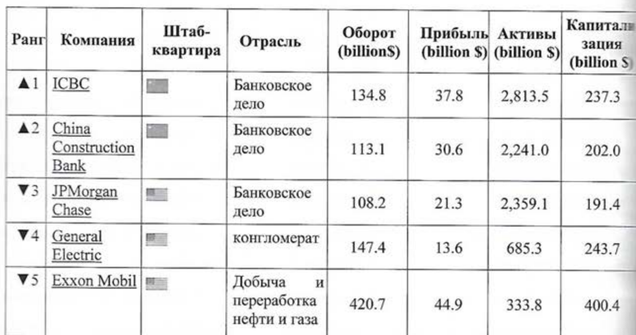
Таблица 1. Лидирующие компании, возглавляющие рейтинг «Global 2000»

В этот рейтинг вошли 30 компаний из России. Лидирующей является "Газпром" (17-е место в общем рейтинге Forbes). По данным журнала, его годовая выручка составила 144 млрд. долларов. Вместе с американской Exxon Mobil и Apple Газпром также вошел в тройку лидеров по прибыли, заработав 40,6 млрд. долларов. Рыночную стоимость российского гиганта эксперты оценила в 111,4 млрд. долларов, общая сумма активов - 339,3 млрд. долларов.