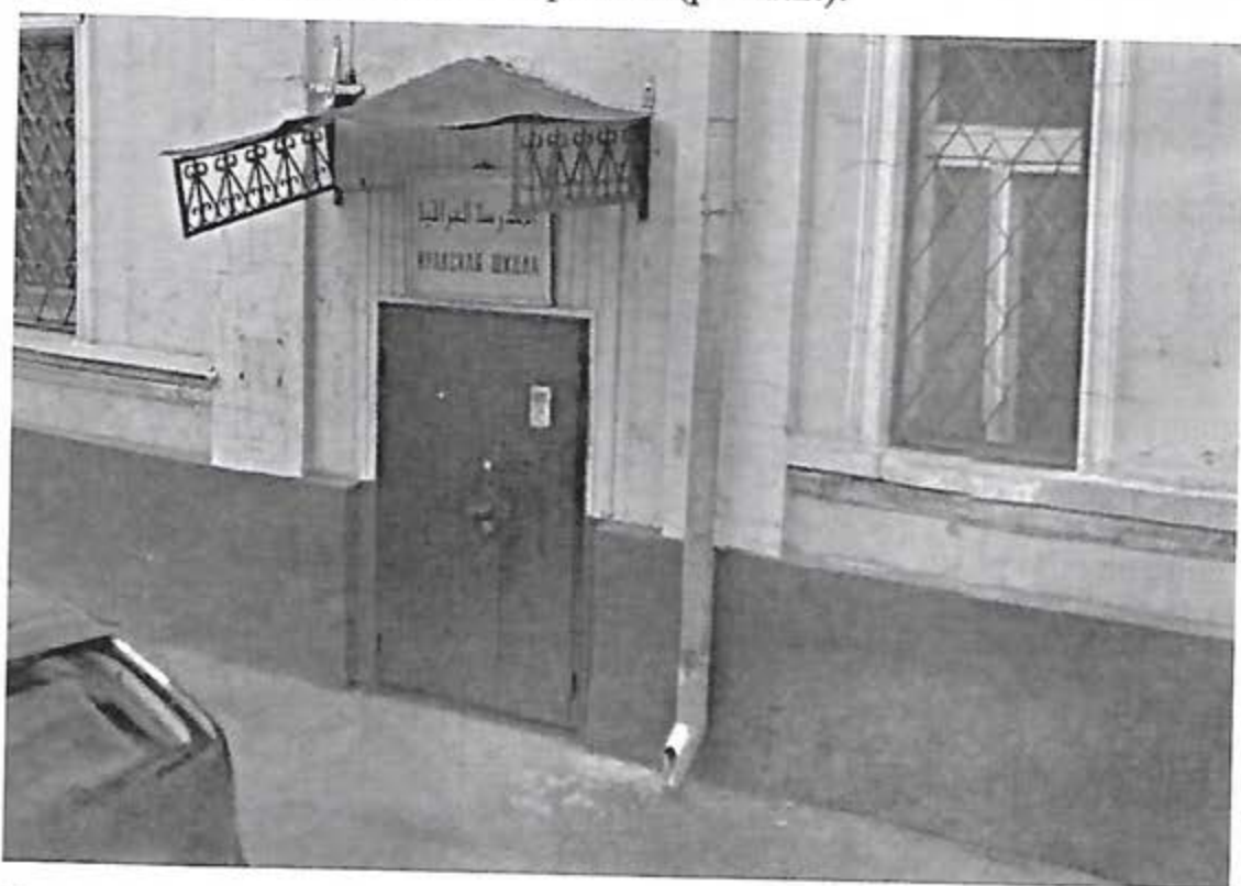
Рис.1.2. Арабская школа

В целом же, никакого контакта между двумя нашими учебными заведениями не было. Два мира. Два совершенно разных мира. Наш мир и их мир. Их мир, в те годы еще не пугающий и неопасный, не вызывающий при виде хиджаба мыслей о терроризме. Но, тем не менее, мир загадочный и чуждый. Кстати сказать, арабская школа пережила ИМЦ и до сих пор находится там же, в Лебяжьем переулке, по тому же адресу. По сведениям интернета, в этой школе на сегодняшний день обучается 280 учеников из разных арабских государств, из них 140 детей дипломатов, 70 человек - беженцы из Сирии, эвакуированные российскими властями на протяжении последних месяцев из зоны конфликта (рис.1.2.).