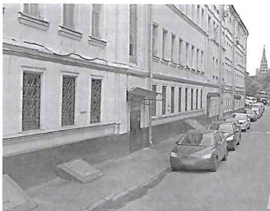
Рис.1.1 Лебяжий переулок

Итак, иду я по утренней Москве, сворачиваю в самую короткую московскую улочку Ленивку, прохожу еще немного, и когда в просвете между домами появляются Кремлевские башни, я останавливаюсь. Лебяжий переулок, дом 5/6 (рис.1.1.). Именно здесь, в этом четырехэтажном, ничем особо не выделяющемся здании и располагался в 1999 году Институт мировых цивилизаций.