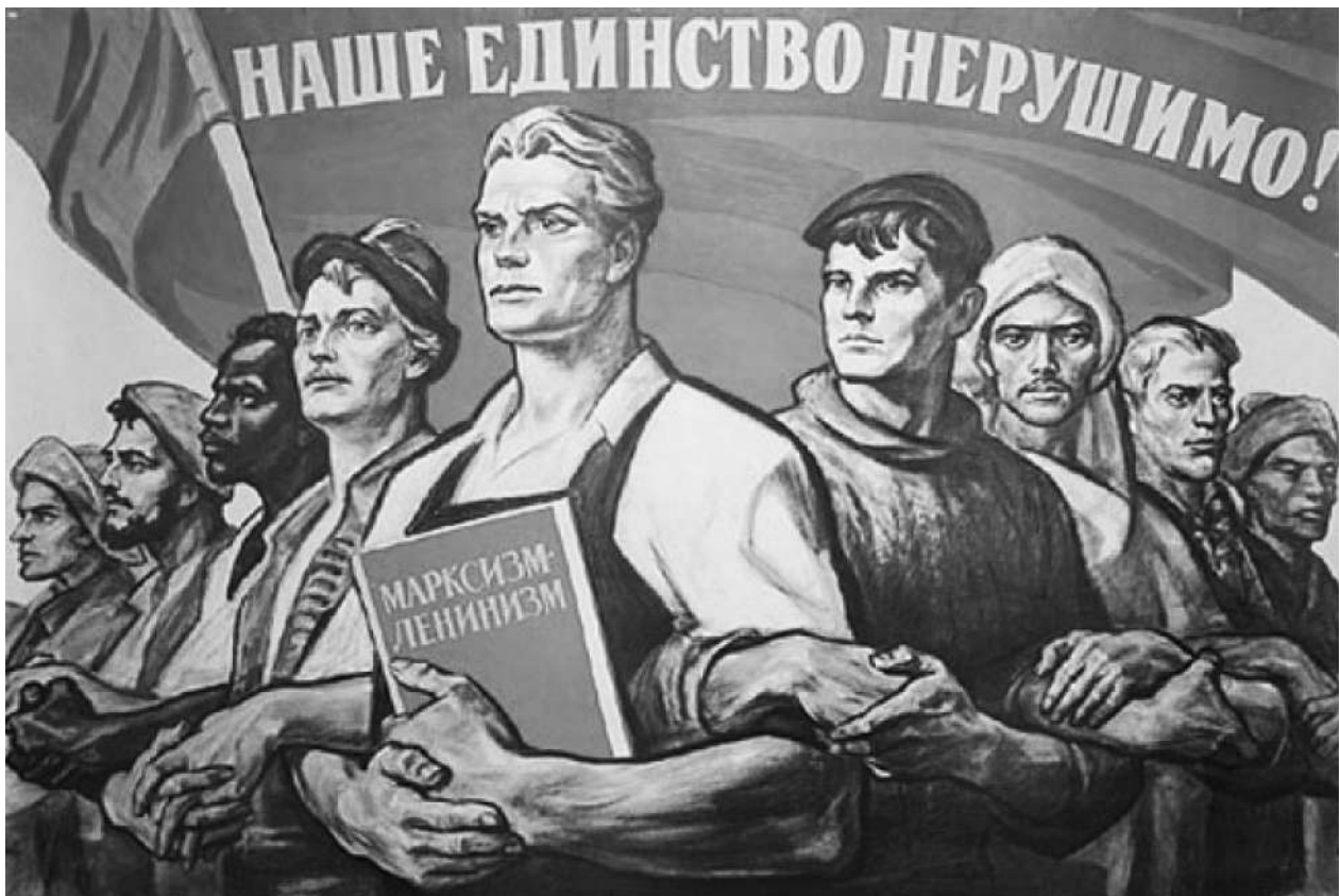
Рис. 1. Плакат «Наше единство нерушимо!».

Издательство «Советский художник», художник И. Тоидзе, 1964 г. 1