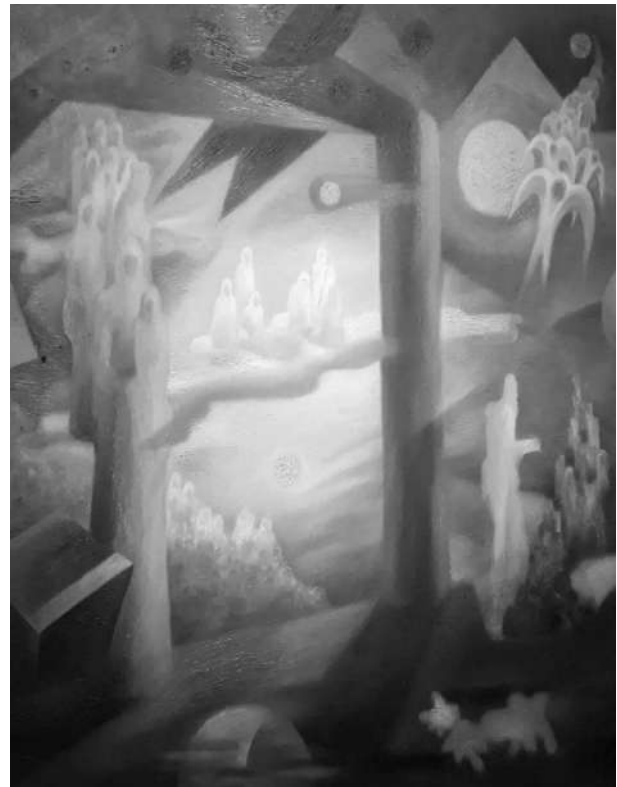
Рис. 13. Исаев А. Дух предков. 1989 г.

В конце 80-х гг. XX века среди художников Узбекистана, как и среди других народов возрастают тенденции обращения к своим национальным корням, национальной идентичности, которая активно продолжается и до сегодняшнего дня (рис. 13, 14).