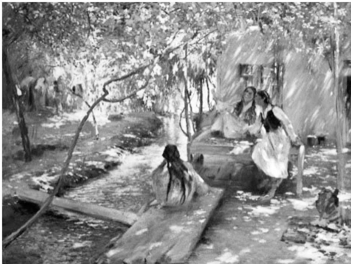
Рис. 7. Беньков П.П. Подруги. Письмо с фронта Узбекистан 1941 г.

ского народа, жилище, одежда, прически. Тема войны присутствует очень опосредованно — девушки читают письмо с фронта от отца (либо брата, мужа), при этом они веселы, трагизм войны не достигает этих мест. Подобного рода произведения также формировали представления о братских узбекском и русском народах, когда один брат приходит на помощь другому, сражаясь плечом к плечу.