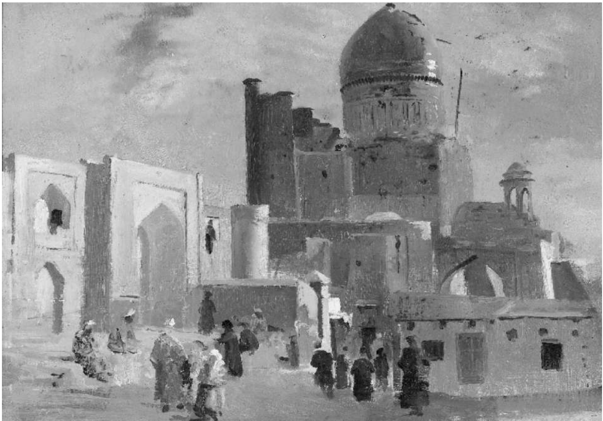
Рис. 4. Котов Н.Г. У мечети. Конец 20-х гг. XX в.

учение в вузах. В итоге в 1937–1938 годах был принят ряд мер по быстрому сворачиванию коренизации и возврату к умеренной русификации.