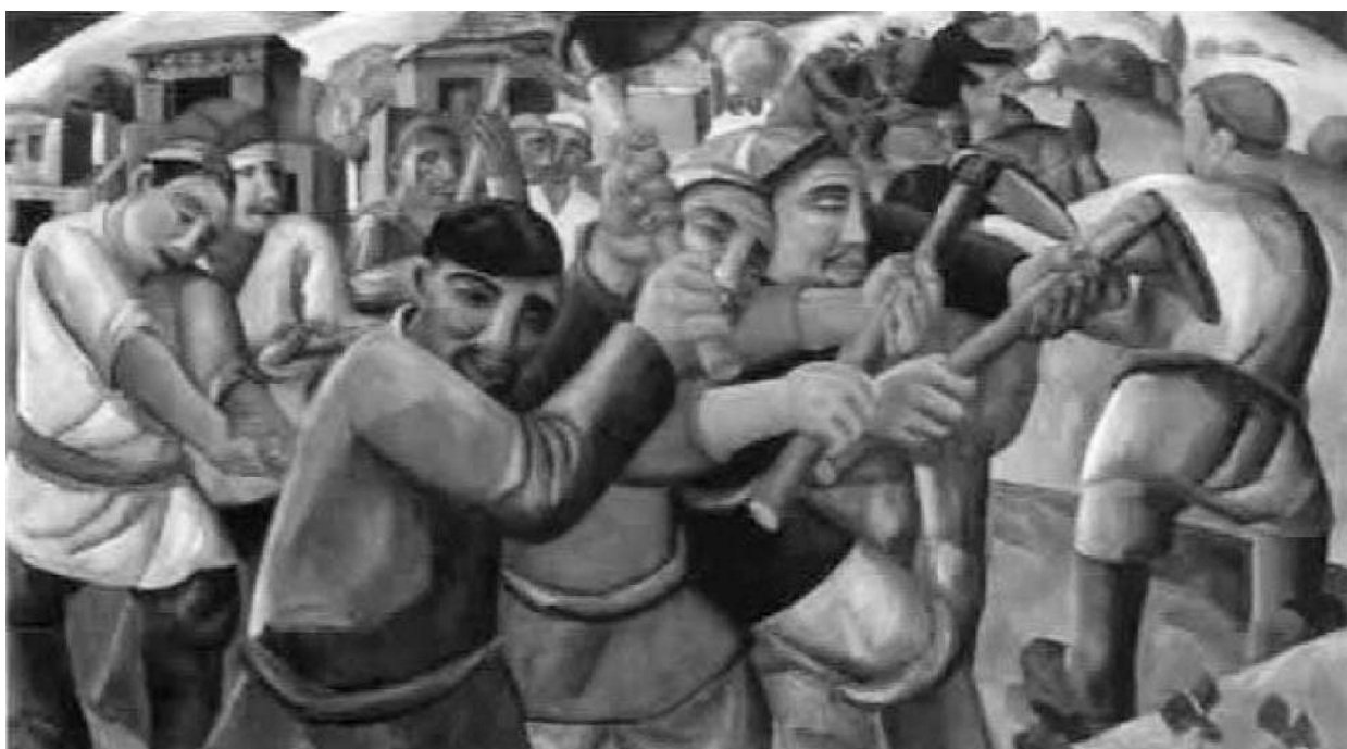
Рис. 3. Волков А.Н. Окучивание хлопка. 1930-е гг.

Тема мирного труда на благо страны продолжается и в других работах, параллельно фиксирующих внешние особенности людей различных национальностей (рис. 3). На картине А. Волкова изображены узбекские декхане (крестьяне), что отчетливо видно по типу их лиц. Безусловно, живописный стиль накладывает определенный отпечаток, в некотором смысле искажая точность передачи черт лица. При этом этнические особенности костюма сведены к минимуму и представлены только тубетейками. При этом на