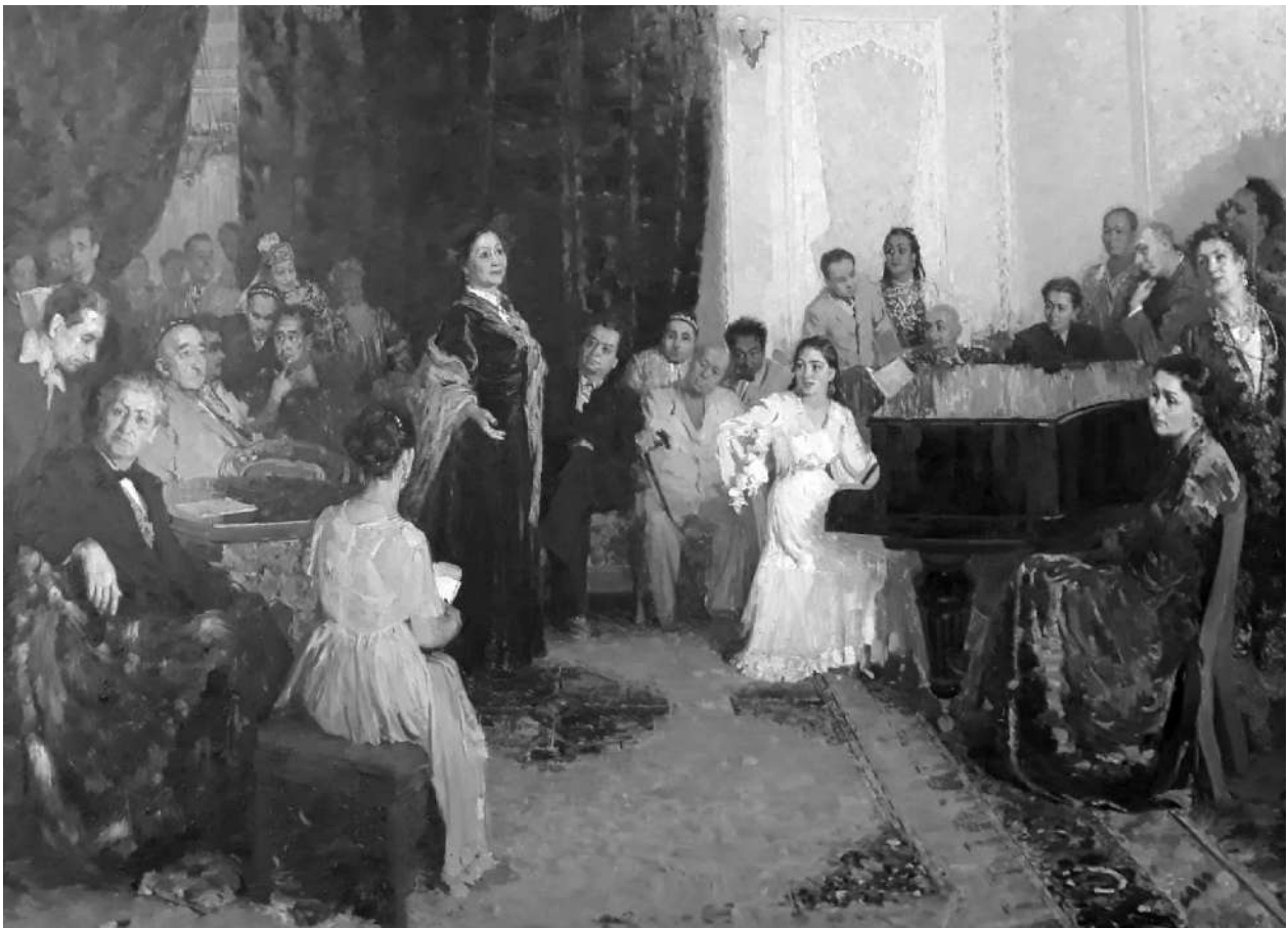
Рис. 9. Елизаров Ю.И. Групповой портрет деятелей искусств Узбекистана. 1958 г.

собой не какую-то новую нацию, а является исторической, более широкой, чем нация нового типа, общностью людей, охватывающей все народы СССР. Понятие «советский народ» появилось как отражение коренных изменений сущности и облика интернациональных черт. Но и при тесном переплетении интернационального и национального в социалистических нациях последние образуют советский народ, оставаясь в то же время его национальными компонентами» [8].