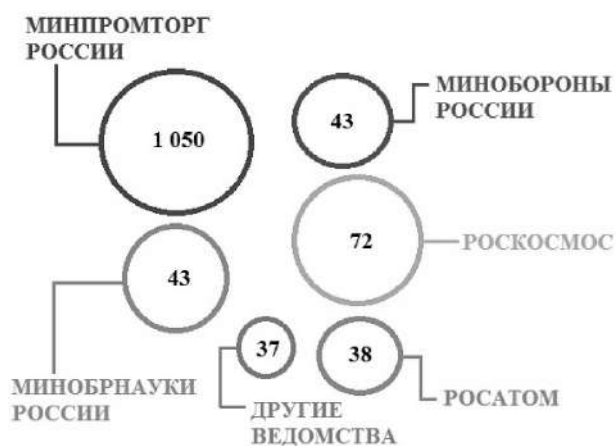
Рис. 1. Ведомственная подчиненность предприятий оборонно-промышленного комплекса России

В контексте отраслевой структуры в состав оборонно-промышленного комплекса в настоящее время входят: