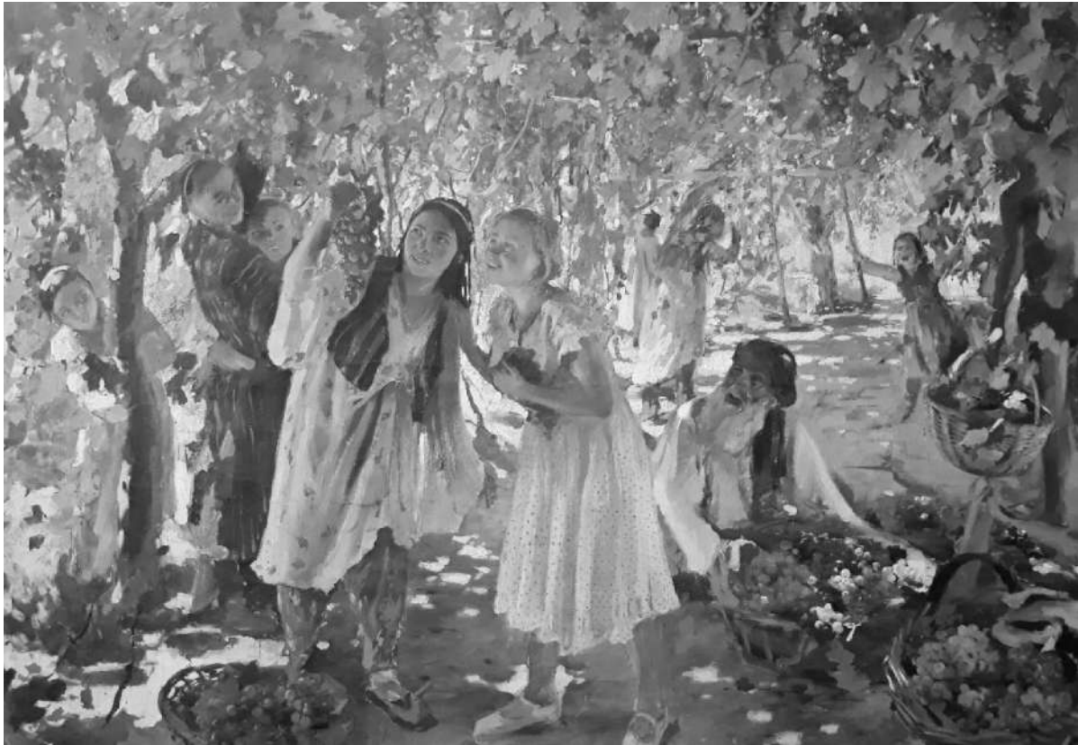
Рис. 6. Беньков П.П. Подруги. 1940 г.

народов. То, что на картине изображены маленькие еще девочки, позволяет предполагать, что дальше их дружба (а соответственно и дружба народов) будет расти и крепнуть, будет пронесена через всю жизнь.