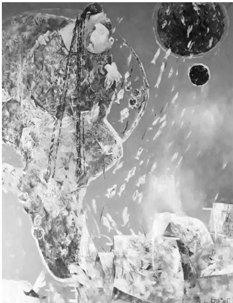
Рис. 14. Джураев Э. Взгляд на жизнь. 2017 г.

ленные тренды в обществе, и тем самым формирует определенные умонастроения в обществе, картину мира. В этом смысле в СССР живопись использовалась крайне неэффективно с целью создания образов братских народов и национальной и гражданской идентичности. Данные приемы весьма эффективно могут действовать и сейчас.