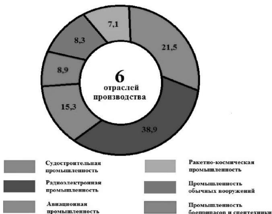
Рис. 2. Отраслевая структура оборонно-промышленного комплекса России, %