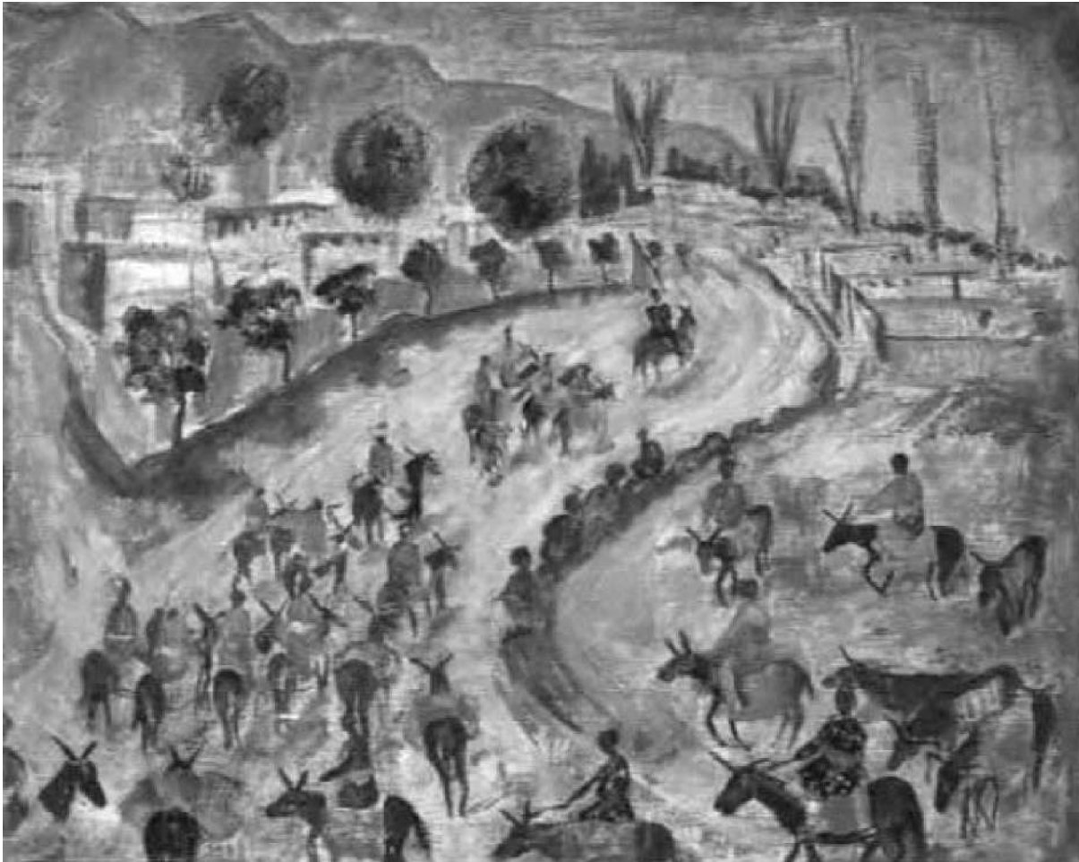
Рис. 2. Соколова О.А. Красный обоз в Ургуче (Сдали хлопок). 1922 г. 2

Одним из символов новой советской России были коллективные формы труда, военный коммунизм, продналог и продразверстка, которые присутствовали не только в центральной России, но и в других регионах (рис. 2).