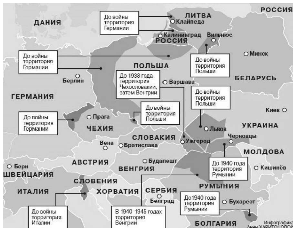
Рис. 2. Территории в Европе, перешедшие к другим государствам по итогам Второй мировой войны (1939–1945)

становлен при определении новых границ Российской Федерации и Украины по итогам Беловежского соглашения, что явилось серьезным нарушением и игнорированием норм международного права 4 .