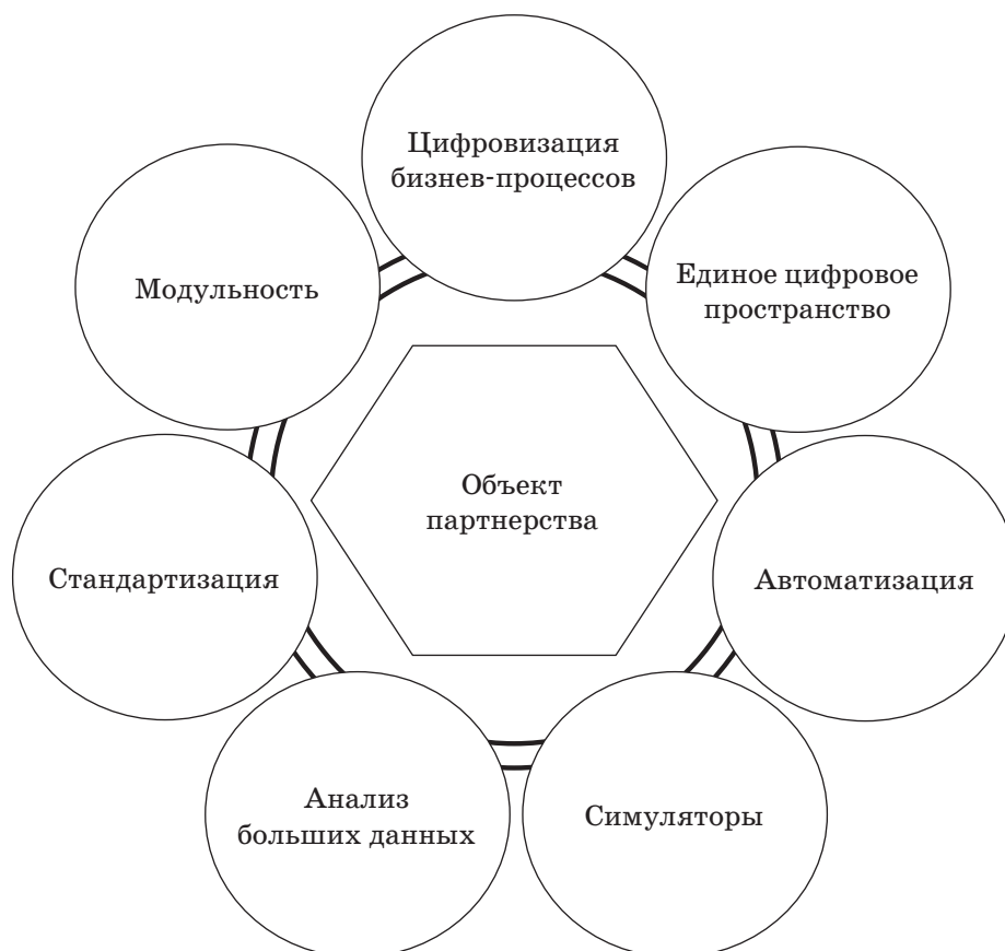
Рис. 1. Инновационные тренды развития цифровизации в контенте муниципальной инновационной политики [4]

Внедрение интегрированного подхода к использованию цифровых технологий и техники дает возможность в определенной степени упростить технологические процессы, начиная с этапов сбора и обоснования необходимых справочных материалов, специального оборудования при проектировании эскизов до завершения инновационно-производственного цикла. Именно интегрированный подход дает возможность формирования точного целостного цифрового актива, который служит идеальной базовой платформой для совместной работы в системе муниципальных образований.