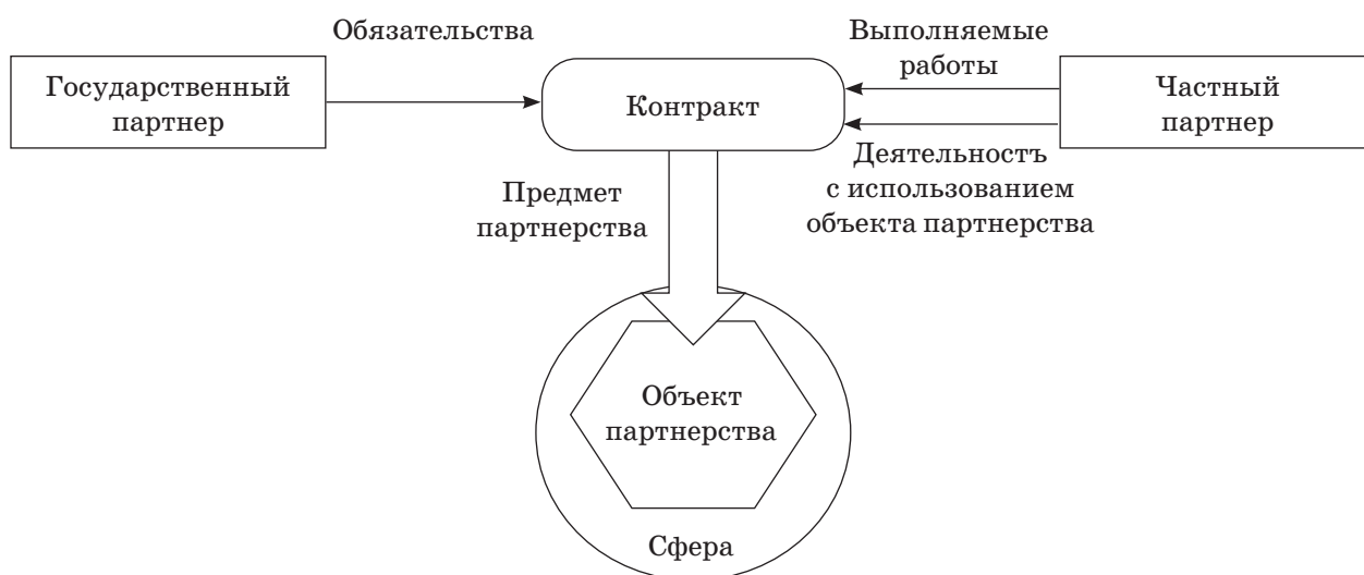
Рис. 1. Схема взаимодействия частного сектора с государством

Для урегулирования взаимодействия субъектов необходимо, прежде всего, привлекать опытных специалистов в области ГЧП еще до начала их разработки, то есть в период планирования. Кроме того, эти специалисты имеют больше опыта и знаний для того, чтобы заниматься делегированием ответственности между участниками проекта, а также они могут способствовать в привлечении государственных служащих в различные проекты крупного масштаба.