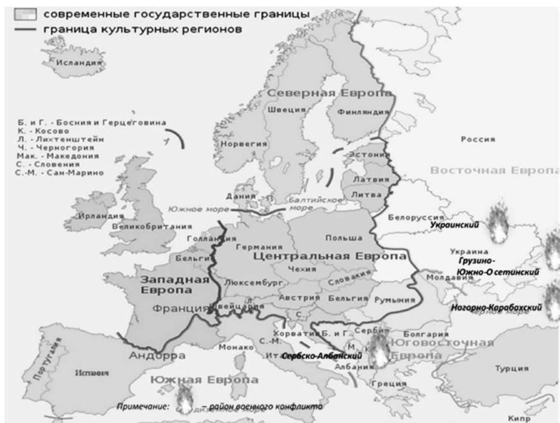
Рис. 1. Регионы Европы и военные конфликты в начале XXI века

тугалия и Испания), залив Лох-Фойл (Ирландия и Великобритания), бухта Долларт Бей (Нидерланды и Германия), Кипр (Греция и Турция), Республика Косово (Сербия и Албания); Северное Косово (Сербия и Республика Косово), Северная Ирландия и Шотландия (суверенитет от Великобритании), Каталония (суверенитет от Испании) и др. Эти территориальные споры имеют давние исторические корни. Это связано с тем, что в Европе имеются территории, которые по итогам Второй мировой войны перешли к другим государствам (рис. 2). В ближайшем будущем они могут стать предметом острых международных разногласий, которые могут перерасти в вооруженный конфликт [4, с. 333, 364].