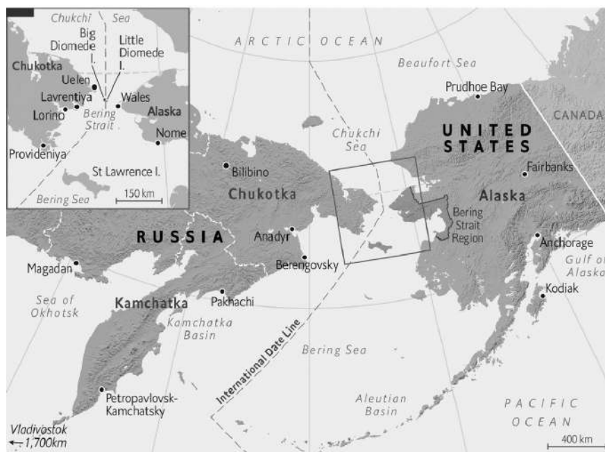
Рис. 2. Административная карта сектора Тихоокеанской Арктики.

2. Процессы, протекающие в этих секторах, имеют весьма существенное пространственно-системное влияние на формирование всего Арктического бассейна и на действие других геопланетарных факторов — геоэкологических, геополитических и геоэкономических.