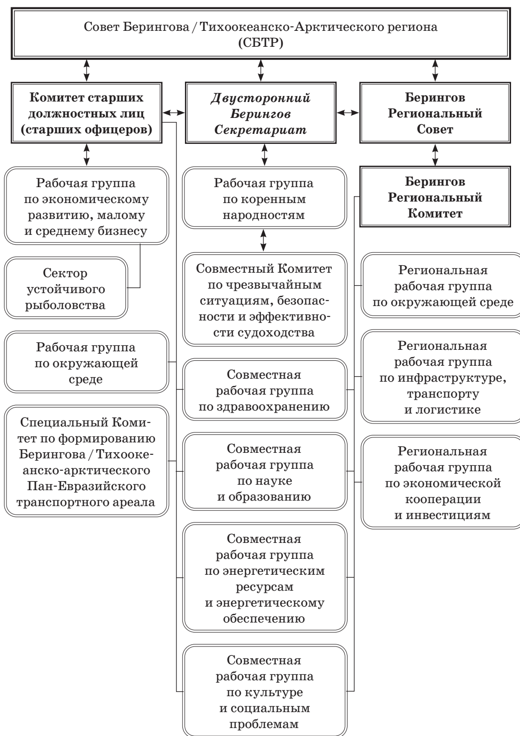
Рис. 4. Структура Совета Берингова/Тихоокеанско-арктического региона.

В частности, С. Лавров, Министр иностранных дел РФ на заседании Совета глав субъектов Российской Федерации в июне 2021 г. уведомил присутствующих на этом собрании, что Москва открыта к дальнейшему развитию сотрудничества с США, в частности — на региональном уровне и заинтересована в создании новых региональных платформ для работы в рамках