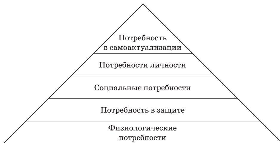
Рис. 1. Иерархия потребностей Маслоу

В период командной работы все нацелены на общий результат и перед каждым участником и командой возникает кризисная ситуация. Джон Бальдони считает, что каждый профессионал должен увеличить ценность свою и ценность команды, для этого он должен задавать себе вопросы в период кризиса команды или личностного: